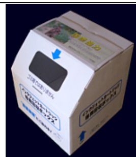
使用済インクカートリッジ回収ボックス

* 2011年2月 ペットボトルキャップ8800個(ワクチン11人分)を回収し、ボランティア団体に寄付。